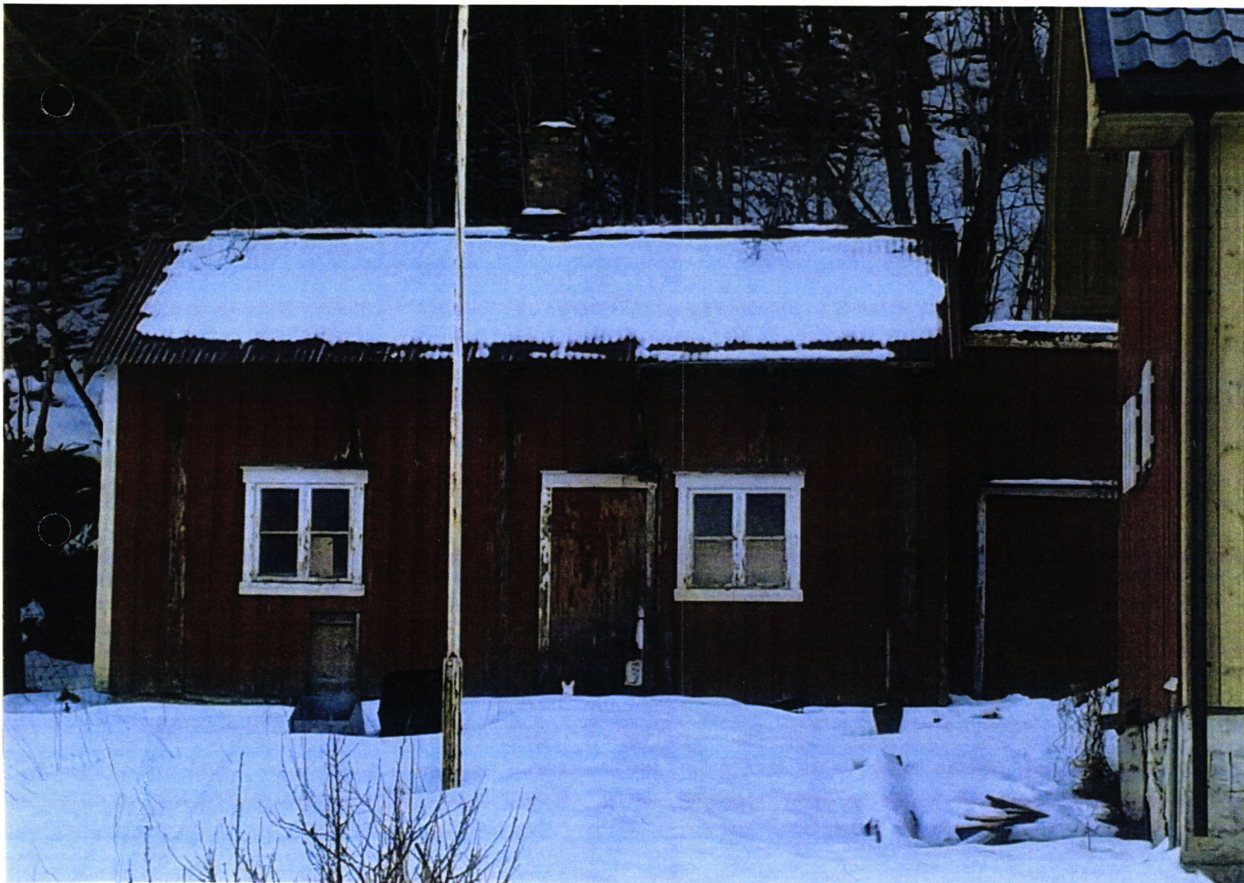
FASADE MOT NORD