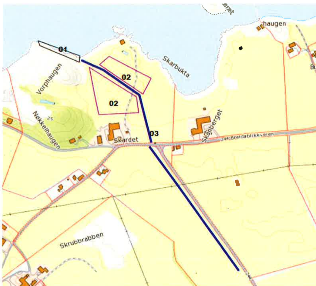
Skisse av foreslått bruk av areal

Det har vært gjennomført befaringer på eiendommen med flere mulige interessenter som finner området meget godt egnet til formålet.