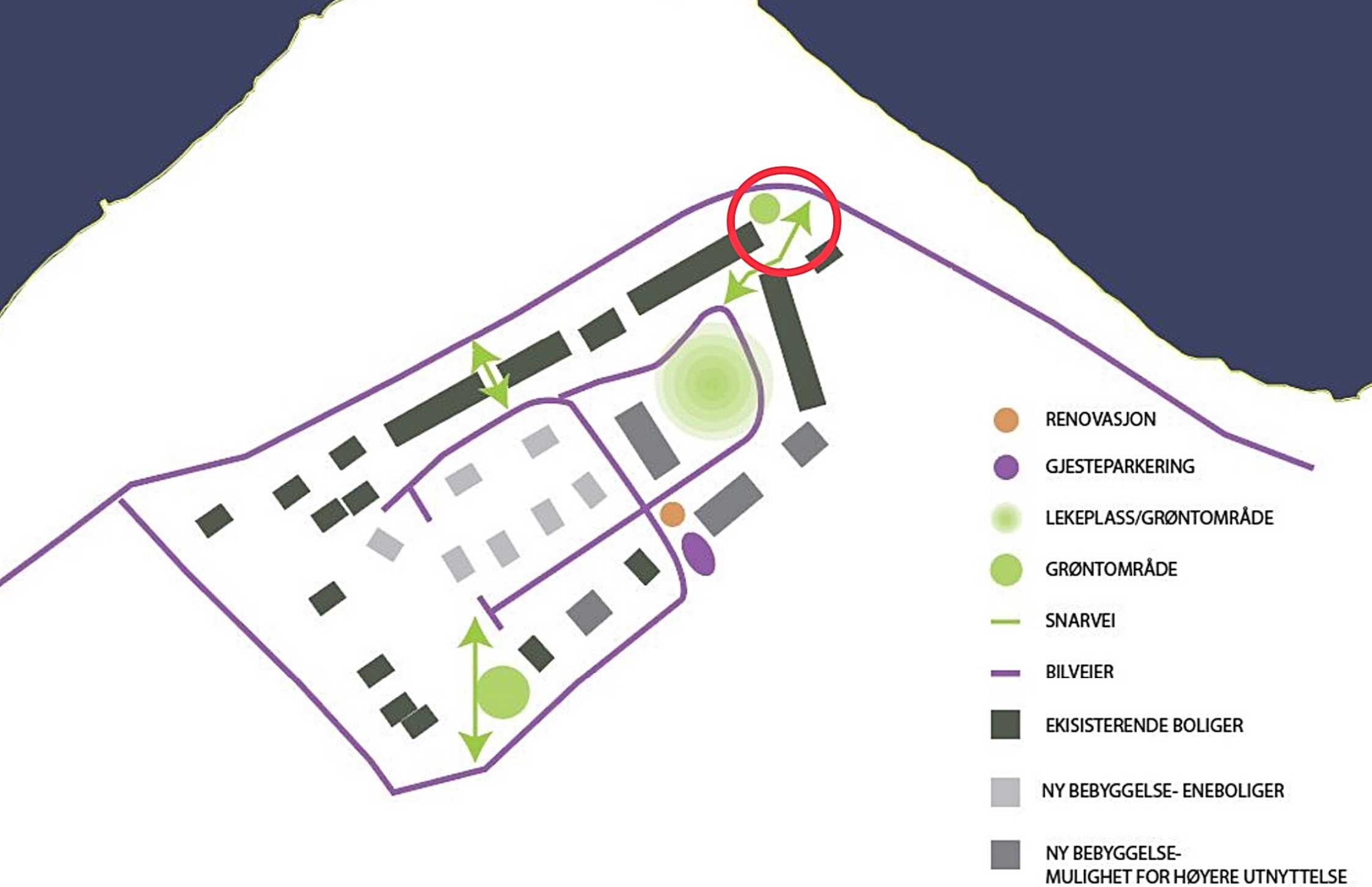
14 Illustrasjon av konsept, som viser planområdet og tilgrensende bebyggelse. Illustrasjon: tegn_3.