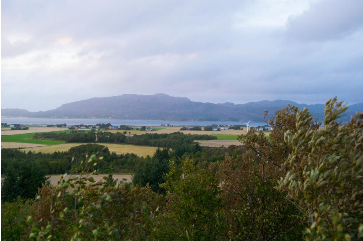
Fra Lerbern utsikt over Innstrand og Nes (Kenneth Ring)