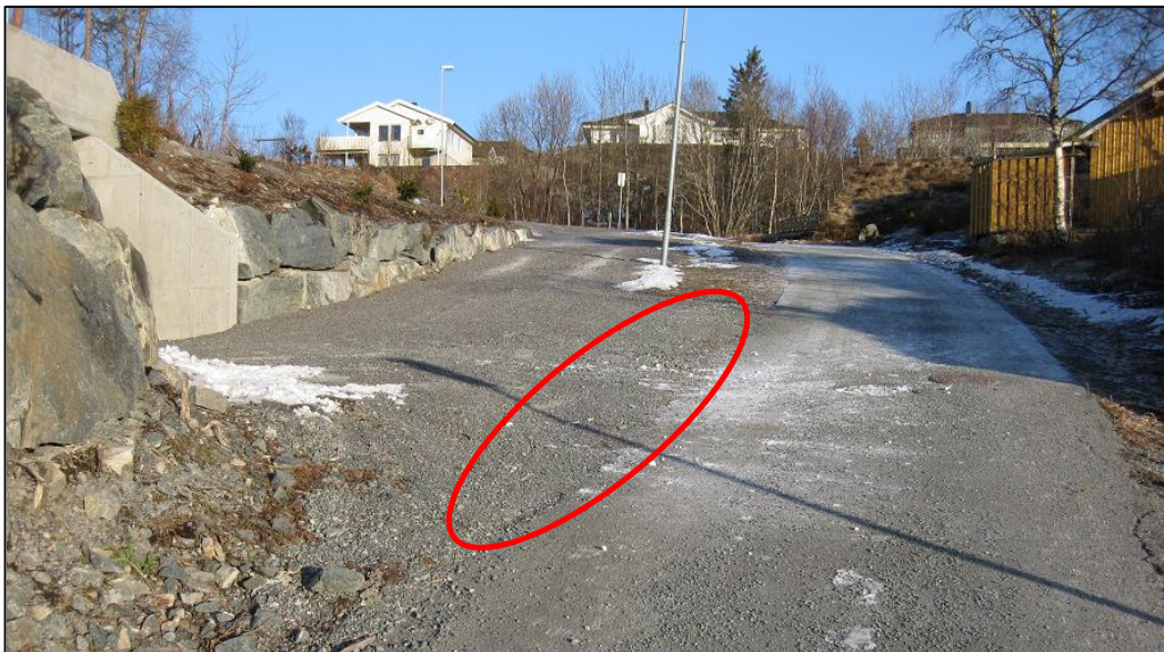
Markering viser hvor det må etableres et aktivt skille mellom adkomstveg og gang- og sykkelsti. Håper dette var klargjørende og at påpekte avvik blir rettet med det første.