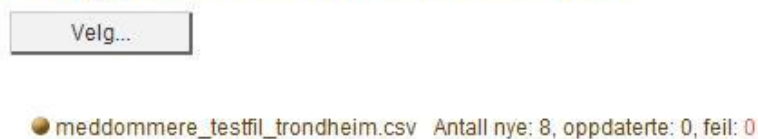
Skjerm bilde 10

Om fila ikke lastes opp vil du få en feilmelding som under. Feil vil oppstå dersom felter i filen ikke blir validert rett. Det kan da for eksempel være at et telefonnummer ikke er på åtte tall eller at det er påkrevde felter som ikke er fylt ut. For jordskiftemeddommere vil dette typisk være " Særlig kyndig i ".