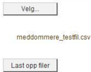
Skjerm bilde 8

Filen som skal lastes opp må være i formatet CSV (kommaseparert). Opplasting av fil i andre formater vil feile, og det kan derfor være greit å ta utgangspunkt i eksempelfilen. Hvis en har en fil som er i formatet CSV (semikolondelt), må denne konverteres til kommaseparert. Dette kan enkelt gjøres ved å åpne filen i et program som notisblokk (notepad), og bruke funksjonen for søk og erstatt.