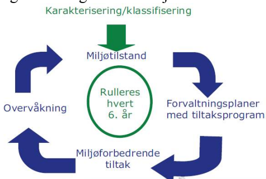
Figur 2. Planhjulet for gjennomføring etter vannforskriften.