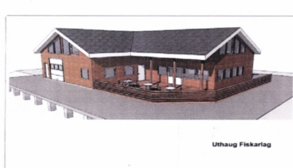
Skisse av flerbrukshuset