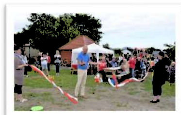
Bilde 5: Lekeclass på Uthaug