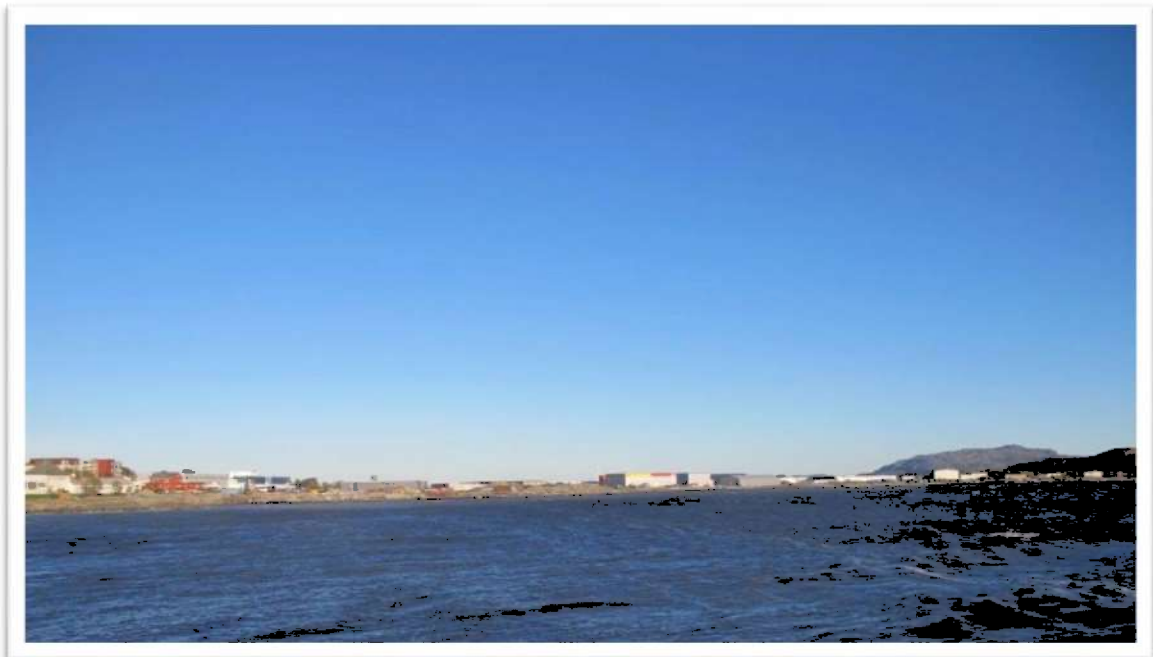
Bilde 2: Brekstadbukta

Det anses ikke behov for revidering eller endring på hovedstrategiene i kommuneplanens samfunnsdel. Kommunedelplaner for tjenesteområdene helse og oppvekst er under arbeid og skal behandles i kommunestyret 15.12.16. Kommuneplanens arealdel er under revidering når det gjelder rød støysone. I tillegg er det kommet signaler fra planutvalget om revidering av sentrumsplan. Områdeplan for Brekstadbukta er ikke endelig avklart per tid, og heller ikke reguleringsplan for Uthaug som gjelder næringsdelen. Begge disse reguleringsplanene vil være viktige når det gjelder framtidig næringsutvikling i Ørland kommune.