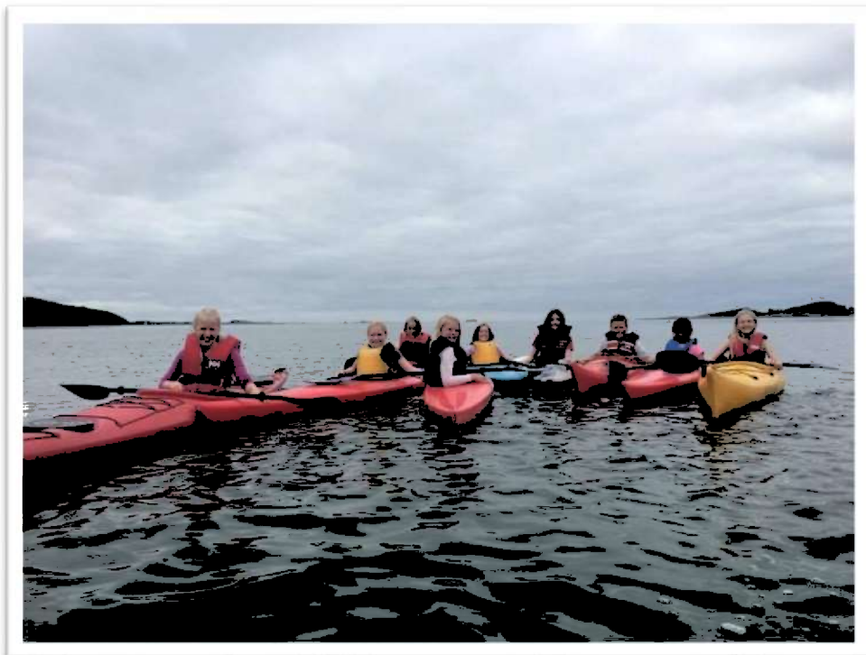
Bilde 1: Elever fra Opphaug skole på kajakkpadling.

Folkehelseinstituttet utarbeider hvert år en folkehelseprofil for kommunen. Ørland scorer dårligere enn landsnivået når det gjelder andel uføretrygdete 18-44 år, arbeidsledige 15-29 år, frafall i videregående skole, ensomhet blant unge, trivsel på skolen i 10. trinn og overvekt hos 17-åringene. Dette er utfordringer som til dels henger sammen.