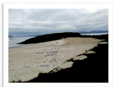
Bilde 3: Austråttstranda

Ørland kommune jobber med nærmiljø og stedsutvikling i et folkehelseperspektiv. Det jobbes med samfunnsutviklingsprosjekter som bidrar til større boattraktivitet på tettstedene Brekstad, Uthaug og Opphaug. Gjennom dialog og folkemøter etableres det attraktive møteplasser uavhengig av alder og livssituasjon.