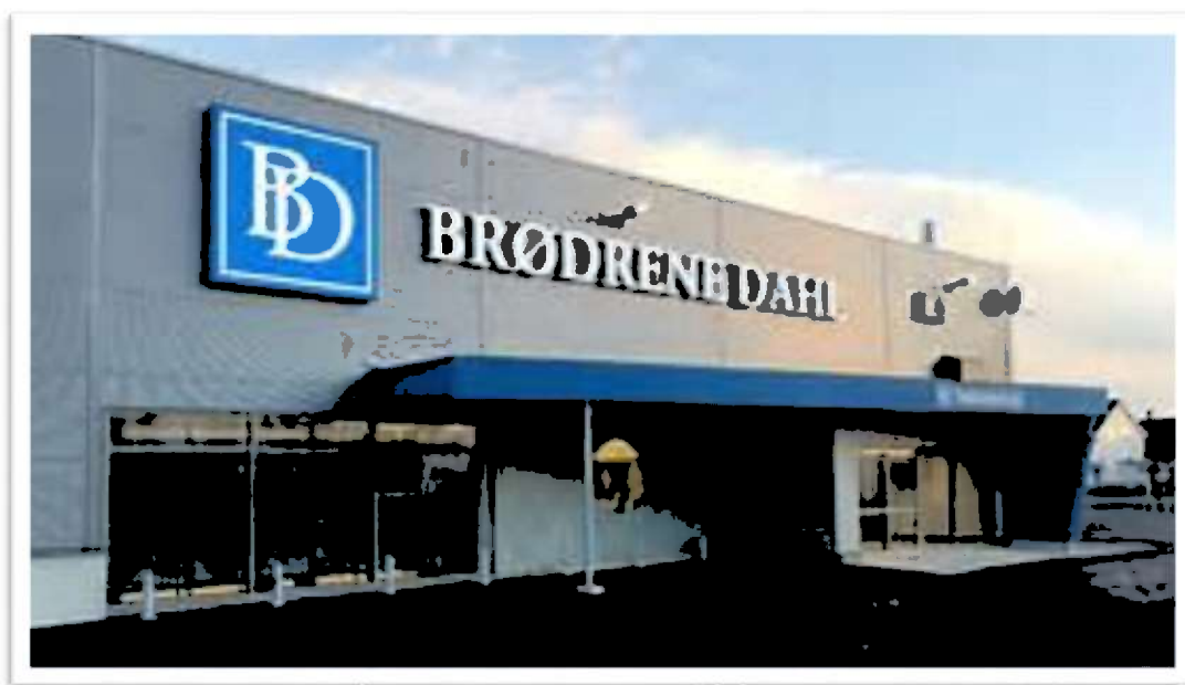
Bilde 6: Brødrene Dahl etablert på Brekstad Vestre

Kommunen må fortsatt tilby kurs og rådgivning til nye og eksisterende næringsaktører, likeså næringskonferanser og bygg- og bomesser som gir kompetanseheving og nettverksbyggin