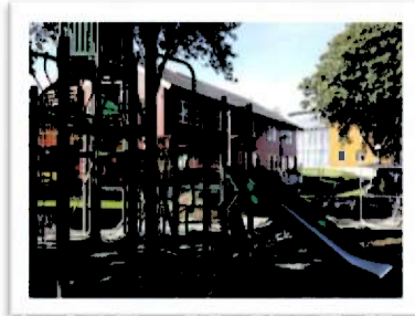
Bilde 4: Meieriparken