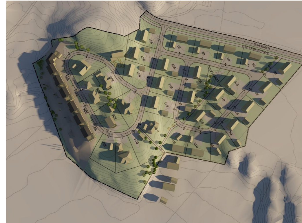
Vårjevndøgn 20. mars kl. 15