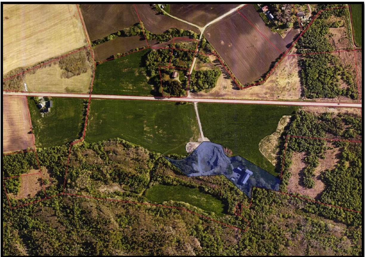
Fig. 1 Orthofoto

Søknaden gjelder planering av tomt for garasje som medfører masseuttak på 15.000-20.000 m 3 på fradelte parsell av eiendommen gnr. 81, bnr. 54 i Ørland.