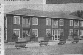
Bygggestart i høst? To bygninger skal romme 21 små leiligheter. I tillegg

SOLVI SAND 72 50 15 76 solvi.sand@altesseid.no