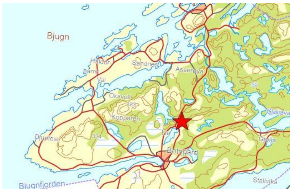
Figur 1. Planområdets beliggenhet

Planområdet ligger nord for Liavatnet i Bjugn, Ørland kommune.