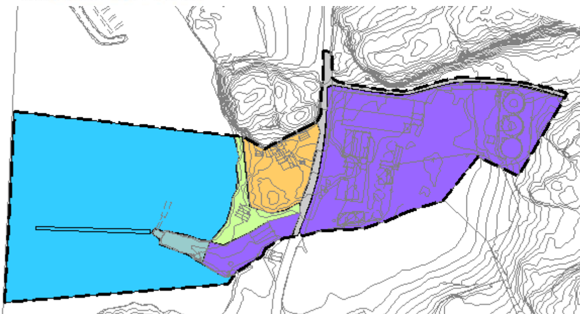
Figur 4. Skisse til ny reguleringsplan. Eksisterende flytebrygge er tegnet omtrentlig inn