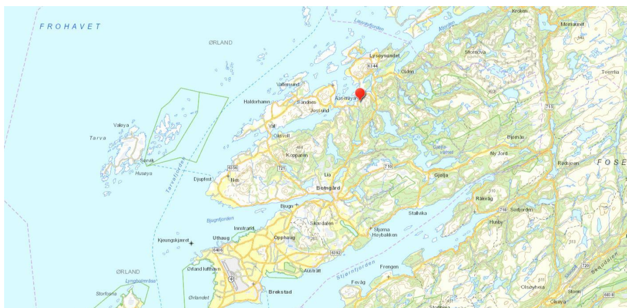
Figur 1. Oversiktskart

I medhold av plan- og bygningslovens § 12-8 kunngjøres det herved at det er igangsatt reguleringsplanarbeid. Kystplan AS er engasjert av Mowi ASA for å utarbeide reguleringsplan for Leikvangbukta. Kommunen har avgjort at planarbeidet ikke skal konsekvensutredes.